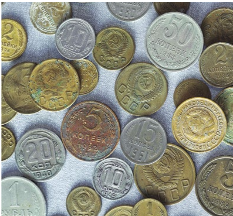
Монеты СССР разных лет

В Архиве президента Российской Федерации сохранился рукописный экземпляр постановления Президиума ЦК КПСС от 30 октября 1958 года по вопросу о деноминации рубля. Он рассматривался руководством СССР в лице Н.С. Хрущева, А.Г. Зверева, А.И. Микояна и А.Н. Косыгина. Было решено «принять предложение товарища Хрущева о проведении деноминации рубля», тогда же определили сокращение «его нарицательной стоимости примерно в 10 раз». Министр финансов СССР Зверев получил поручение «с соблюдением строгой