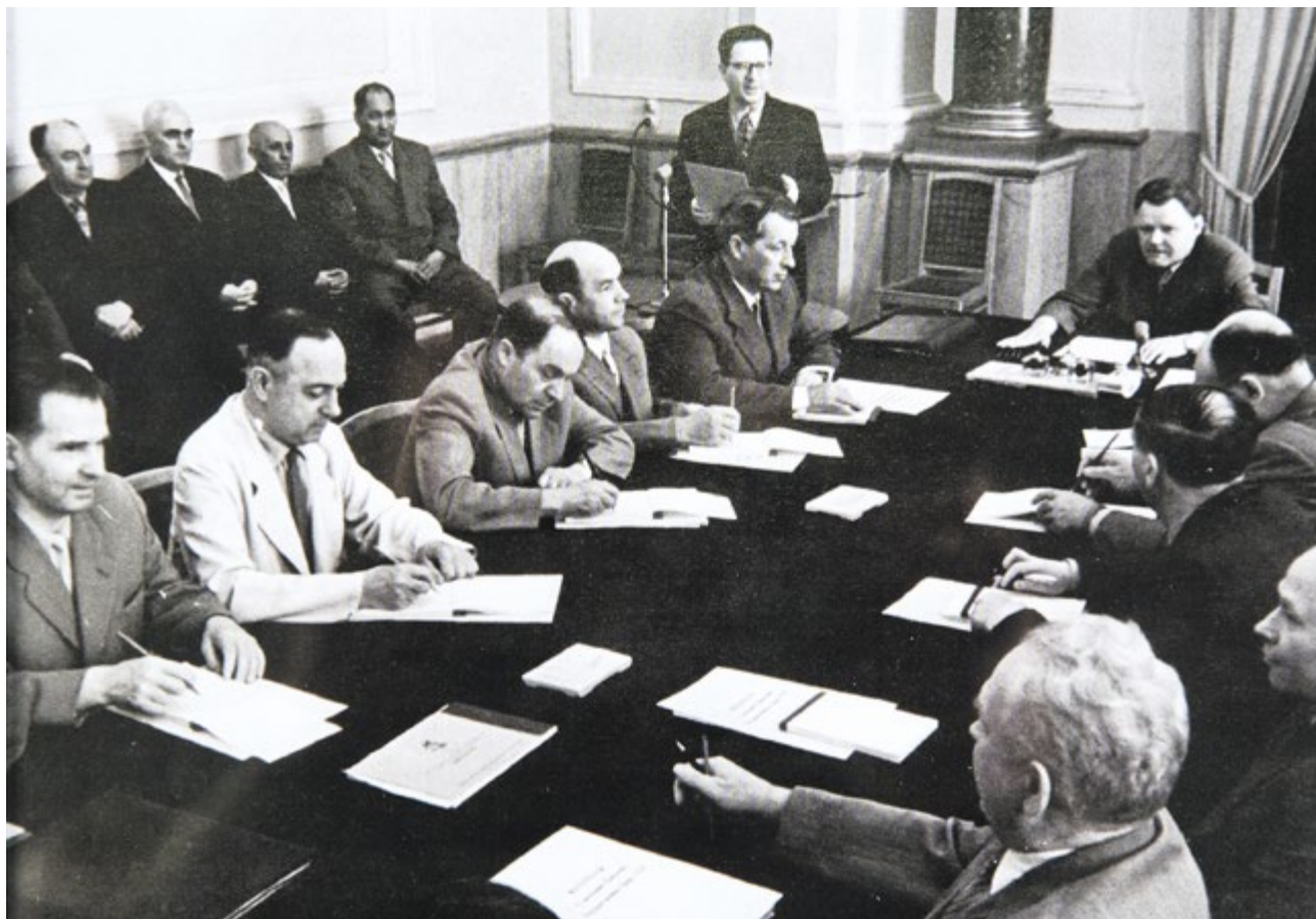
Заседание правления Государствен- ного банка СССР. Начало 1960-х годов