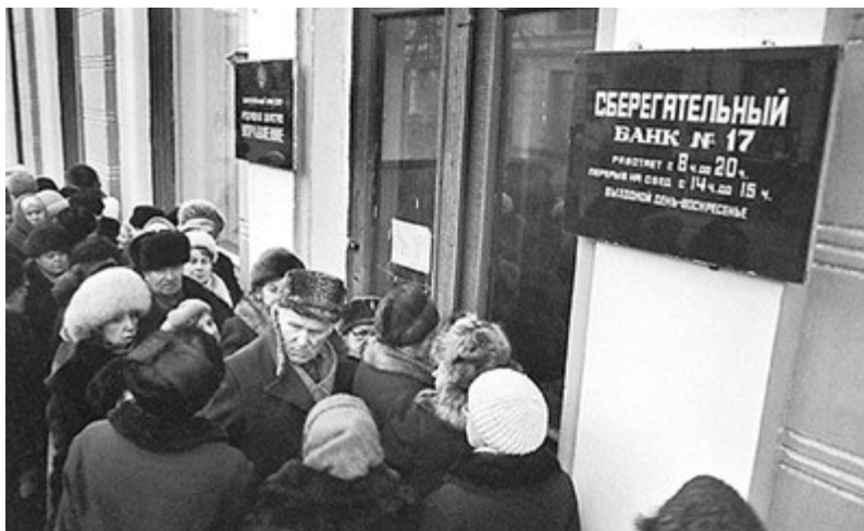
Очередь в отделение Сбербанка. 1961 год

Эскизы советских бумажных денег образца 1961 года, как и было положено, разрабатывались